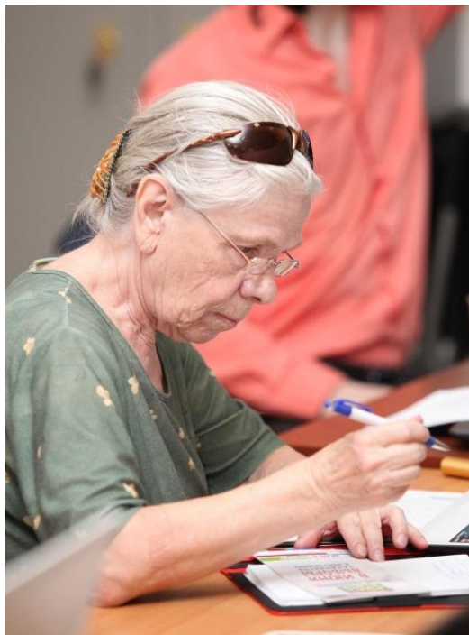
Проект «Серебряное кино» Организатор: Фонд поддержки и развития русско-немецких отношений «Русско-немецкий Центр встреч при Петрикирхе Санкт-Петербурга»