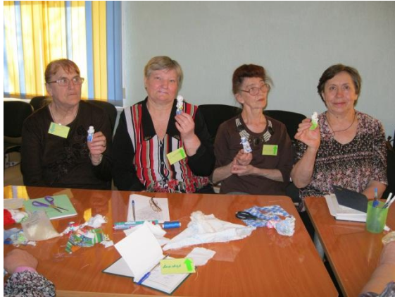
Проект «Навстречу друг другу» Организатор: центр «Семья плюс» г. Барнаул