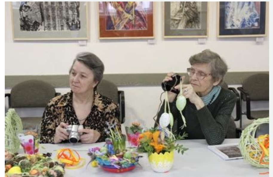
Проект «Школа немолодого предпринимателя» Организатор: ФПМС «Территория успеха» г. Краснокамск